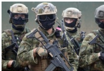
Zagreb dobiva Hrvatski vojni muzej