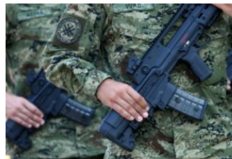
VIDEO: Građani o vojnom roku