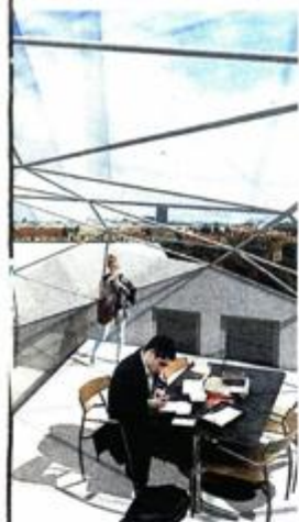
U podrumu obnovljene palače Gvozdanić trebao bi biti kafić (gore), staklni krov krasit će Etnografski muzej (sredina), a Tehnički muzej (dolje) dobit će odjel za inovatore i komunikaciju